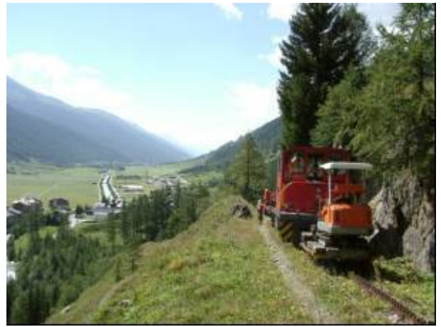
Bauzug vor Oberwald