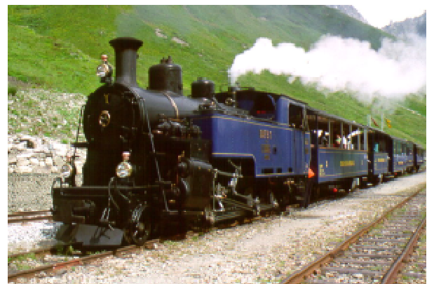
Dampfzug vor der Station Furka