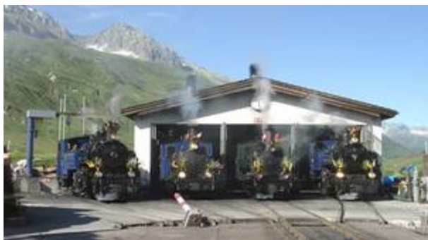
Lokparade vor dem Depot Realp