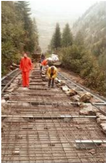
Fronarbeit auf der Strecke